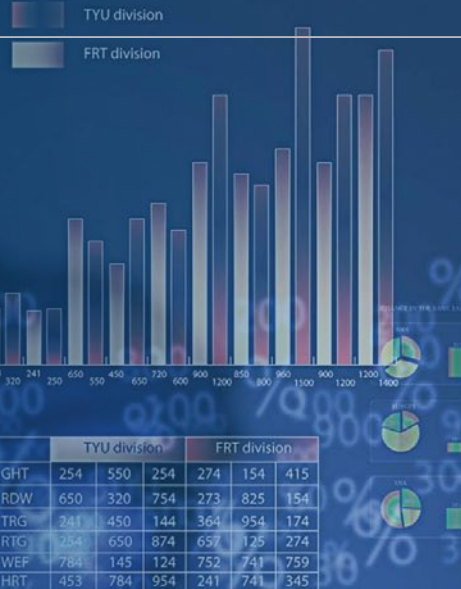
Revenue growth divisions.

สหรัฐอเมริกา : ภาพรวมของเศรษฐกิจในปี 2558 ก่อนข้างจะสดใส เศรษฐกิจสหรัฐมีแนวโน้มที่จะฟื้นตัวอย่างต่อเนื่อง GDP(g) สำหรับปี 2558 คาดว่าจะอยู่ที่ 3.5% เทียบกับระดับ 2.3% ในปี 2557 สะท้อนความเชื่อมั่นในการลงทุนของภาค Real Sectors เรามองว่าการปรับขึ้นอัตราดอกเบี้ยนโยบายของธนาคารกลางสหรัฐฯ จะเกิดอย่างรวดเร็วที่สุดในช่วงไตรมาสที่ 3 ของปี 2558 เป็นต้นไป