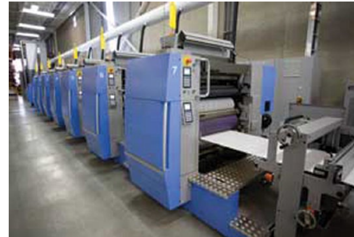
รูป 1 ตัวอย่างเครื่องพิมพ์ลูกผสมประกอบด้วยหน่วยพิมพ์ฟลักซ์และออฟเซต เรียงแถวต่อเนื่อง Image 1 Example of Hybrid Printer which comprises of rows of Flexo and Offset Units