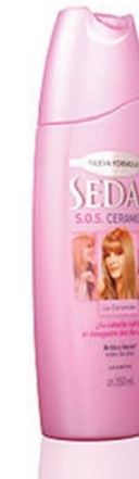
รูป 2 ฉลากบนขวดแชมพู ที่พิมพ์ด้วยเครื่องพิมพ์ลูกผสม Image 2 Shampoo Label printed by Hybrid Printer