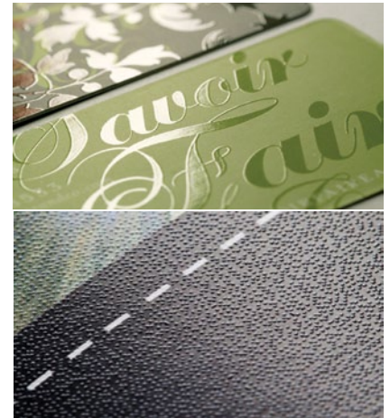
รูป 3 ตัวอย่างภาพไฮบริดจากเทคนิคการเคลือบผิว Image 3 Example of Hybrid Coating

ความสำเร็จของเทคโนโลยีลูกผสมหรือไฮบริดนี้ อยู่ที่การพัฒนาหมึกพิมพ์และสารเคลือบ ให้สอดคล้องกับการทำงานของเครื่องพิมพ์ได้ โดยเฉพาะความเร็ว และไม่มีปัญหาเกิดขึ้น