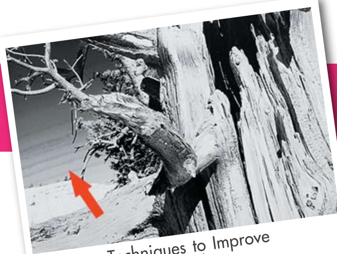
Techniques to Improve Printing Quality

Solving printing problems would enable a printing house to increase printing production efficiency. The techniques for solving printing problems are: