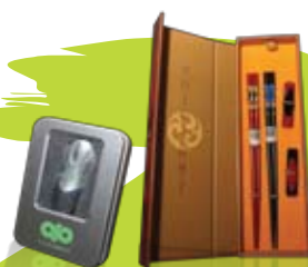
Premium gift set