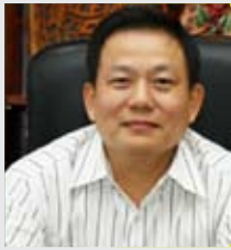
NEVIA NEWS GUEST