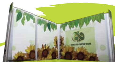
Sun Flower Set

ของรางวัล !! ที่ระลึก จาก โกลด์ อีสท์ เพลเปอร์ และ ซี.เอ.เอส.เพลเปอร์ เพียงคุณส่งคำตอบมาจ้ง E-mail : hi-cas@hotmail.com รับของรางวัลทันที รางวัลมีจำนวนจำกัด สำหรับ 100 ท่านแรกที่ส่งคำตอบ ส่งก่อนมีสิทธิ์ก่อนนะ: